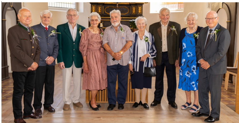
die 70iger: Jahrgang 1955