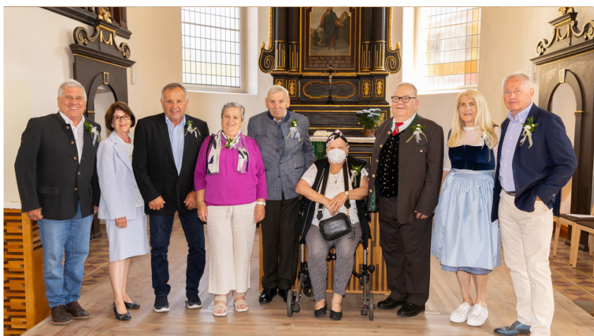
die 60iger: Jahrgang 1965