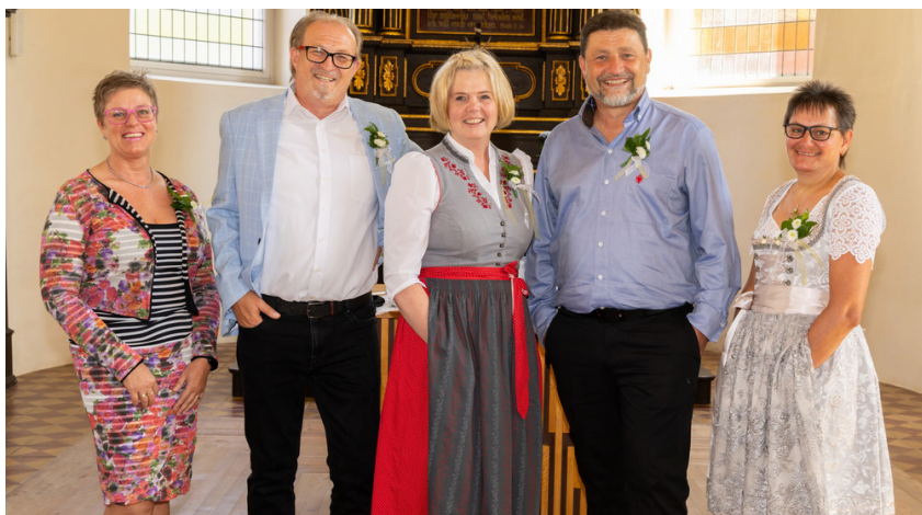
die 40iger: Jahrgang 1985