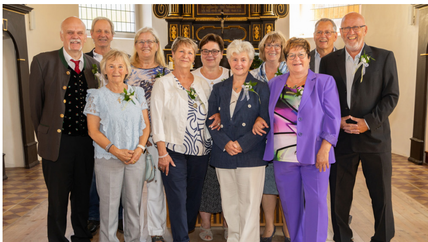
die 50iger: Jahrgang 1975